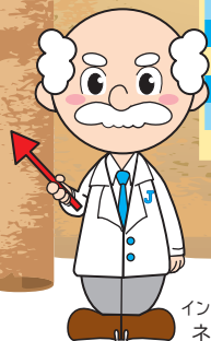
インターネット研究所 ネットソン博士