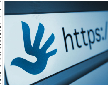
The human rights logo (the dove-like hand on the left) was chosen via a crowdsourced online competition involving people from 100 countries submitting over 15,000 entries.

We disagree. Human rights are a bundle that includes both an abstract expression of the right and some means for enabling that right. Freedom of the press, for example, is enshrined in the First Amendment to the U.S. Constitution. It would make little sense to say that press freedom is a human right, but that governments remain free to limit access to printing technology. Furthermore, something may be a human right, and yet still change over time. The technology available to Benjamin Franklin was dramatically different from that available to today's blogger, but that in no way mitigates Franklin's and the blogger's rights to their individual technologies under the general umbrella of freedom of the press. But the ques-